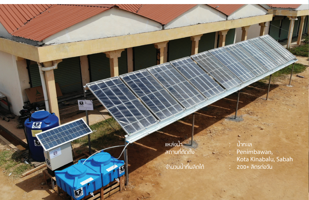
แหล่งน้ำ : น้ำทะเล สถานที่ติดตั้ง : Penimbawan, Kota Kinabalu, Sabah จำนวนน้ำที่ผลิตได้ : 200+ ลิตรต่อวัน

เอกลักษณ์ในการแยกตัวของน้ำ ตามหลักการธรรมชาติของสาร ทำให้ระบบ WATER INFINITY ผลิตน้ำดื่มที่สะอาด น้ำที่ยังไม่ระเหยออกคือน้ำที่ไม่ผ่านการบำบัดที่สมบูรณ์ จะไหลลงออกจากแผง CAROCELL™ และส่งกลับเข้าสู่ถังรับน้ำ เพื่อส่งกลับเข้าสู่ระบบ WATER INFINITY อีกครั้ง และผ่านแผง CAROCELL™ เพื่อทำการบำบัดได้หลายครั้งจนกว่าจะได้น้ำดื่มบริสุทธิ์ ซึ่งการส่งกลับเข้าสู่ระบบได้หลายครั้งทำให้ไม่สูญเสียทรัพยากรน้ำ ซึ่งเหมาะสมเป็นอย่างยิ่งในพื้นที่ที่ขาดแคลนแหล่งน้ำ